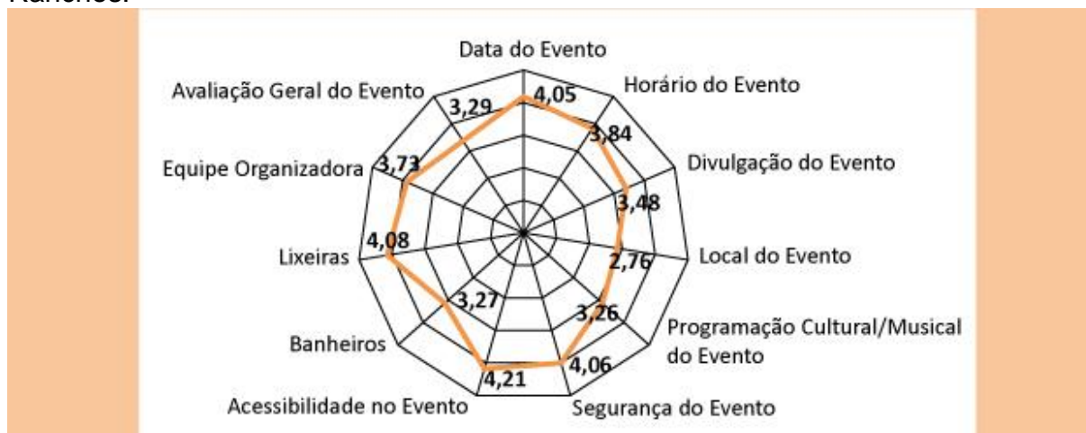
Gráfico 2: Avaliação do Planejamento e Organização do Carnaval em Três Ranchos.